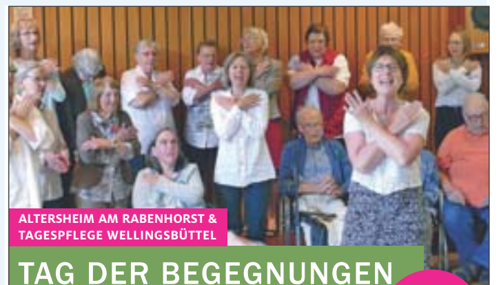
ALTERSHEIM AM RABENHORST & TAGESPFLEGE WELLINGSBÜTTEL