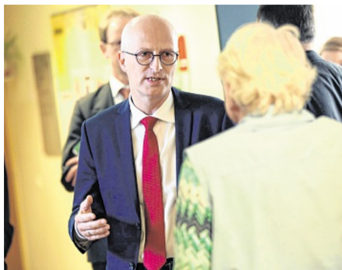
Bürgermeister Peter Tschentscher (SPD) im Gespräch mit einer Pflegeheim-Bewohnerin.